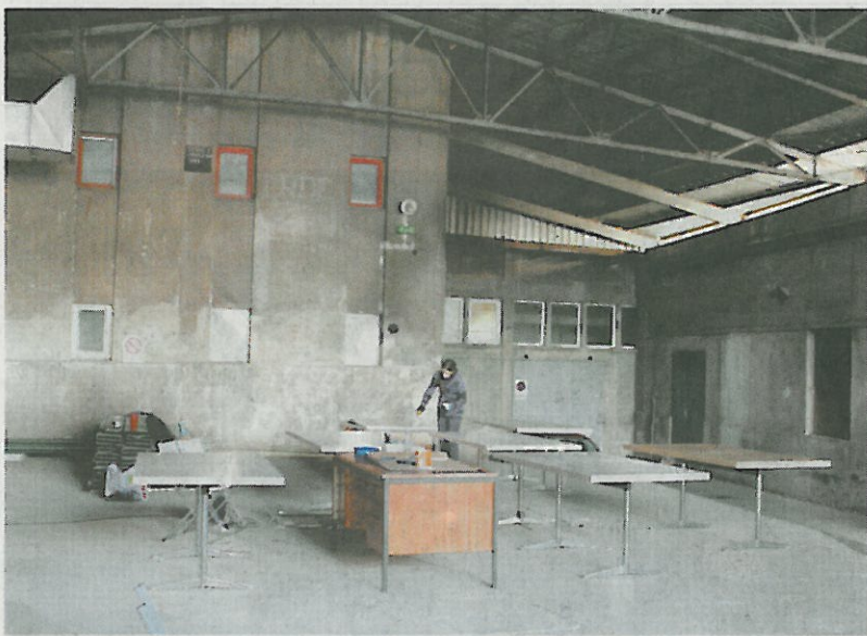
Prostori CAAP-a na Valvasorjevi ulici bodo zaživel 16. novembra (Vanja Bučan)