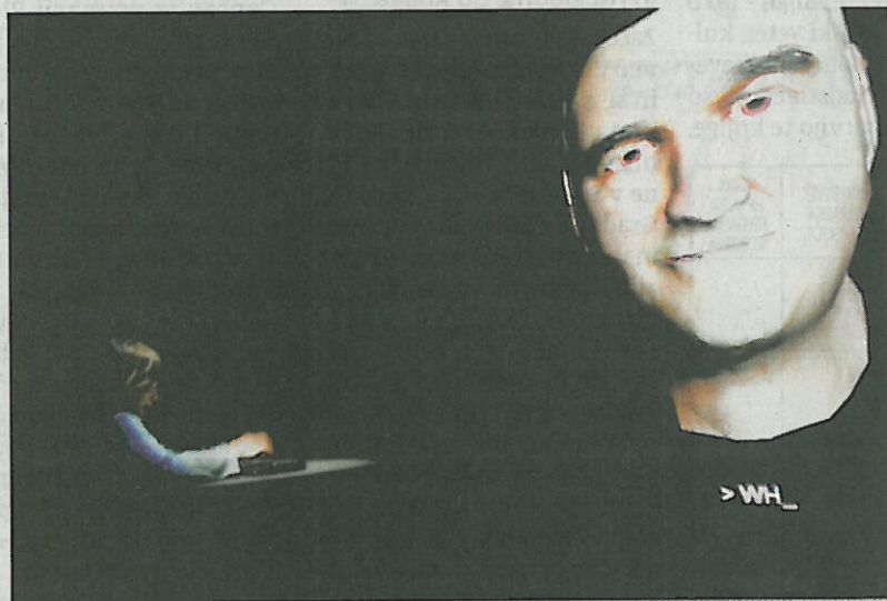
Instalacija slovitega bodiartista Stelarca

mejenega tehnološkega razvoja in ekonomske ekspanzije. Včeraj in danes je v Portalu tudi mednarodna konferenca s teoretiki in umetniki iz Evrope, ZDA, Kanade, Japonske, Avstralije, Rusije in Singapurja kot glavni dogodek izobraževalnega programa projekta Soft Control. Med udeleženci konference so priznani strokovnjaki s področja so-