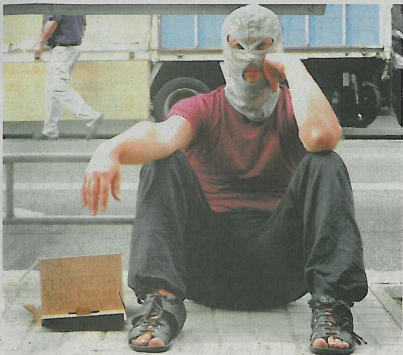
Video Borisa Kadina (Hrvaška) Jaz sem terorist; pomagajte mi, prosim, ki se ukvarja s položajem državljana v času katastrofičnih državnih ekonomskih politik